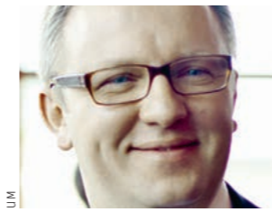
dr hab. KRZYSZTOF SZCZERŃSKI profesor UJ, poseł na Sejm

Pierwszy dzień VII Konferencji Krakowskiej zamknie panel poświęcony wolności, zaufaniu i współpracy, z udziałem m.in. PROF. PIOTRA SZTOMPKI z Uniwersytetu Jagiellońskiego. Socjolog nawiąże do znanego hasła: „Nie ma wolności bez solidarności” – i odwoła się do jego podwójnego znaczenia.