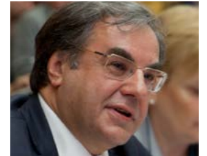
JANUSZ SEPIOŁ , senator RP, przewodniczący Senackiej Komisji Samorządu Terytorialnego i Administracji Publicznej

Nr 23/2014 Dodatek przygotowany we współpracy z Urzędem Marszałkowskim Województwa Małopolskiego